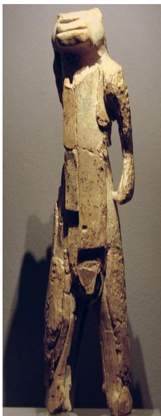
Человек-лев. Германия. 40 000 – 35 000 лет