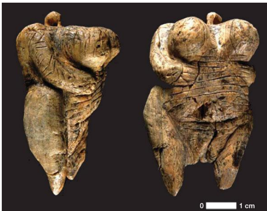
Женская фигурка. Германия. 40 000 – 35 000 лет