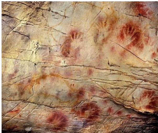
В пещере Эль Кастильо. Испания. 40 000 лет

Теперь для науки стало совершенно очевидно, что технологическая революция в Европе, начало которой оценивается в 40 000 лет назад и которая, по сути, продолжается до нашего времени, была не менее значительна для истории человечества, чем неолитическая революция с возникновением скотоводства и земледелия и изобретением керамики и металлургическая революция 3-го тысячелетия до нашей эры с которой начался второй этап истории человечества – металлический век.