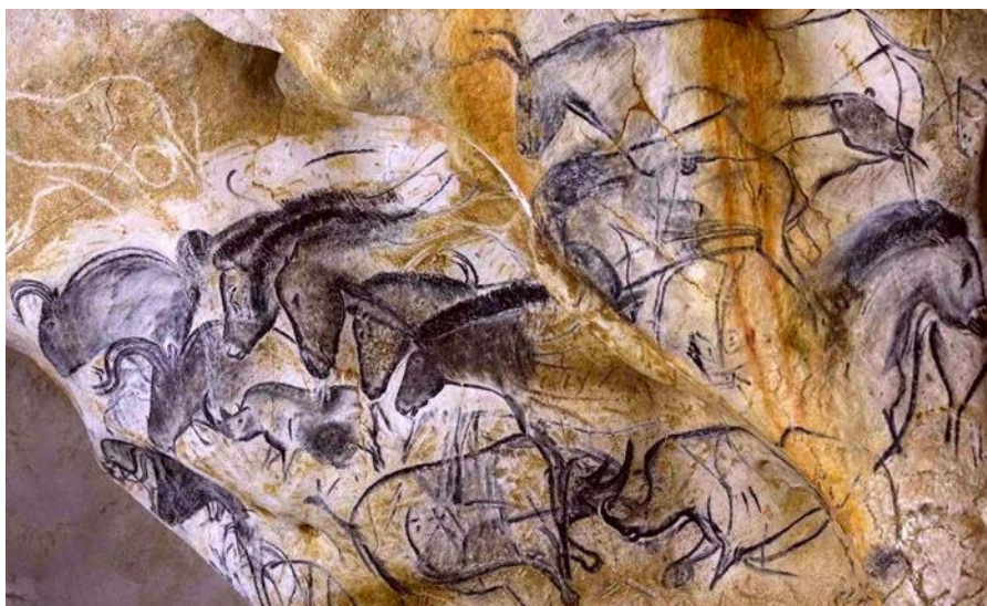
Рисунки углем из пещеры Шове. Франция. Около 36 000 лет